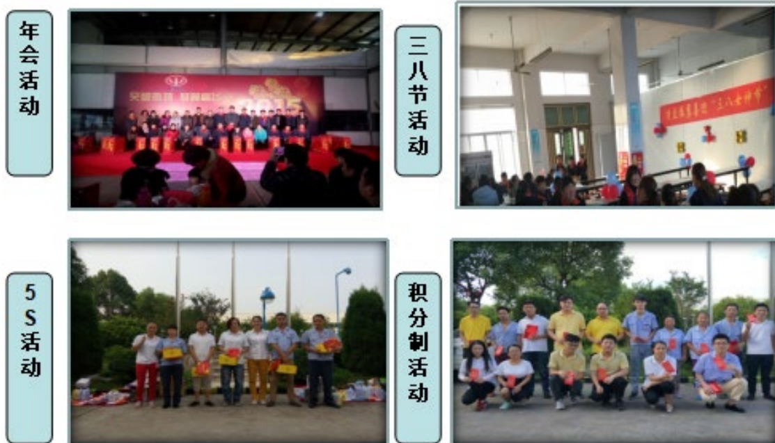
丰富多彩的文体活动

公司除了生产上的安全关注，公司也十分重视员工的文化建设和健康。这主要体现在我们努力为员工创造舒适的工作环境和生活环境，如办公室和车间、食堂和宿舍、运动和休闲、阅读及娱乐等等。除了硬件保障之外，我们还通过诸如为员工举办生日会，劳动技能竞赛、员工聚餐和文娱活动等员工活动来调动员工的工作激情，丰富员工的业余生活，获得了员工的广泛好评。如下图：